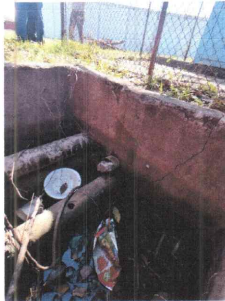
Foto 2. Vista del cableado subterráneo en donde las raíces empiezan a llegar y provocaron grietas que amenazan con seguir provocando daños.