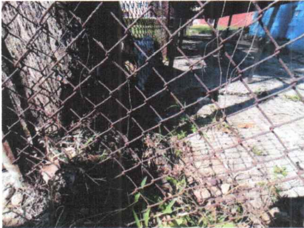
Foto 1. Vista lateral del Macuilis a un costado de la subestación eléctrica del Centro de intercomunicación. Las raíces ya levantaron el pavimento y siguen avanzando.