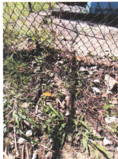
Foto 4. Las raíces empiezan a ser superficiales, lo que provoca que el árbol no esté bien anclado al suelo.